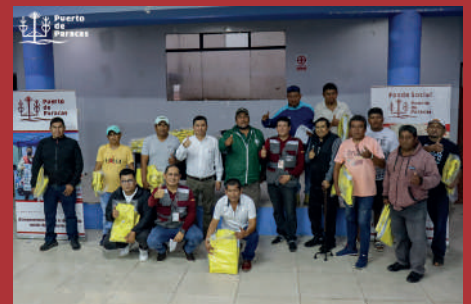
Formalización de pescadores.