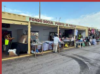
Habilitación de stand para venta de artesanía.