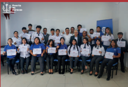
Becas Puerto de Paracas.