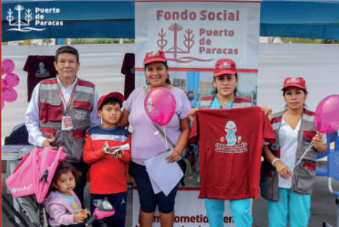
Programa de Lucha contra la Anemia.