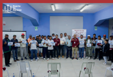
Curso de insulado en fibra de vidrio.