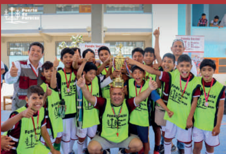
Formación integral de niños a través del deporte