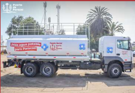
Donación de camión Cisterna de Agua.