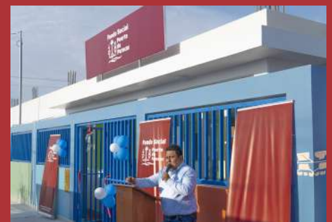
Construcción de wawa wasi en el H.U. Nueva Juventud