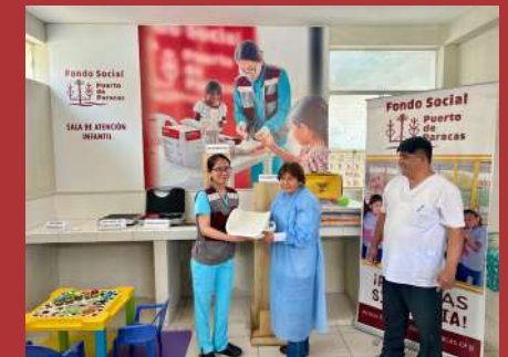
Implementación de la sala de atención infantil en el CLAS San Andres