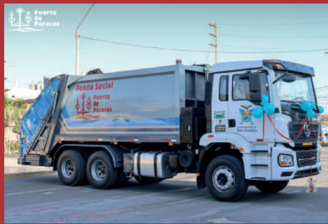
Mejora del manejo de residuo solidos en Paracas y San Andres.